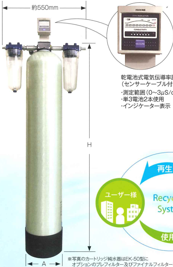
乾電池式電気伝導率計 (センサーケーブル付き) ・測定範囲(0~3μS/cm) ・単3電池2本使用 ・インジケータ表示

※写真のカートリッジ純水器はEK-50型にオプションのプレフィルター及びファイナルフィルターを設置したものです。